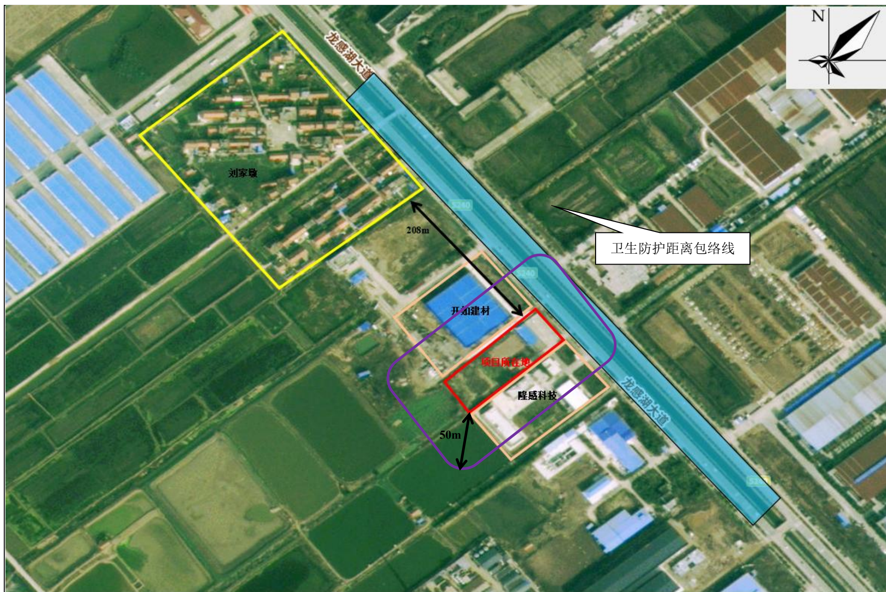
附图5 项目卫生防护距离包络线图