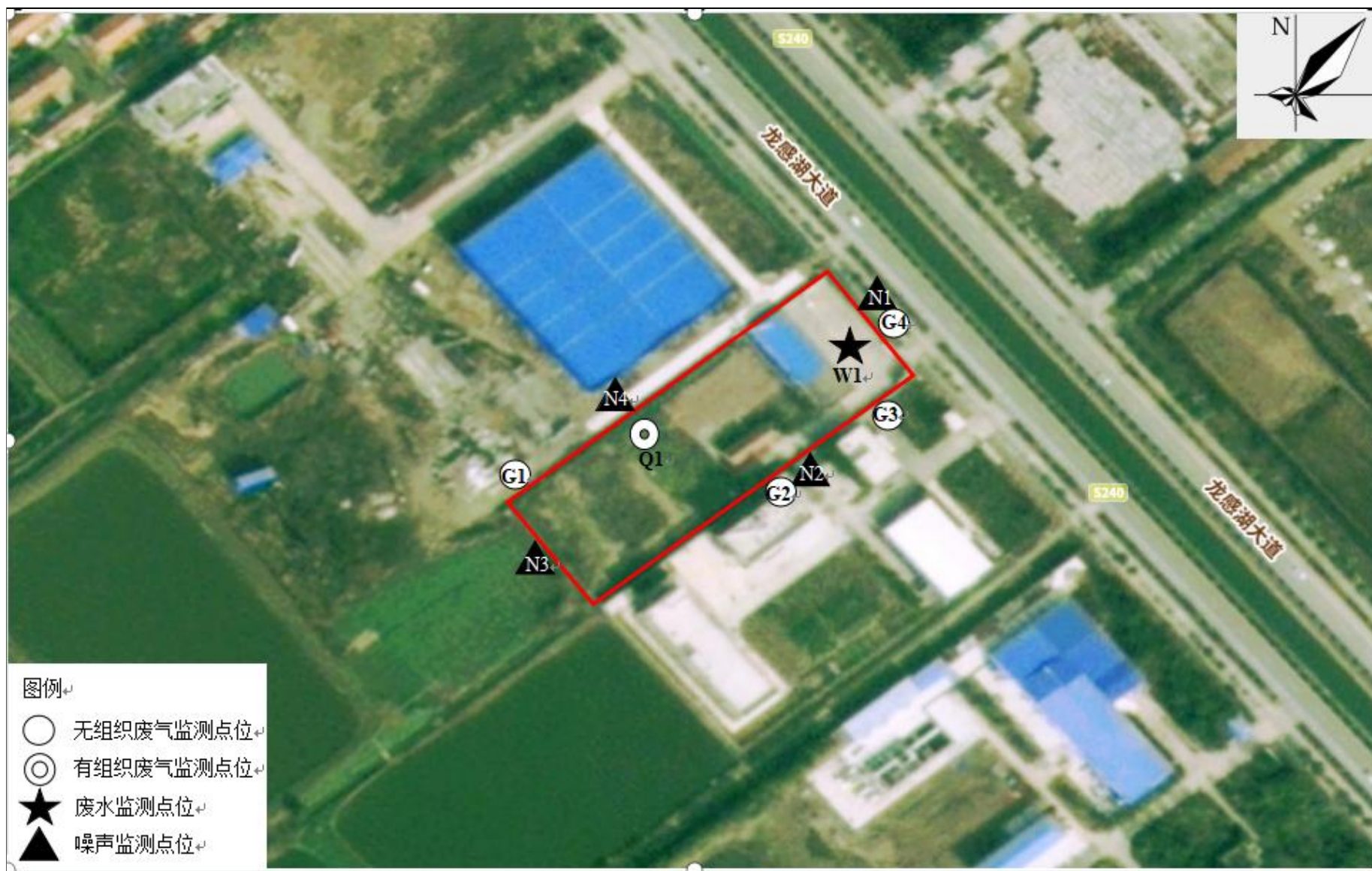
附图 4 项目监测点位图