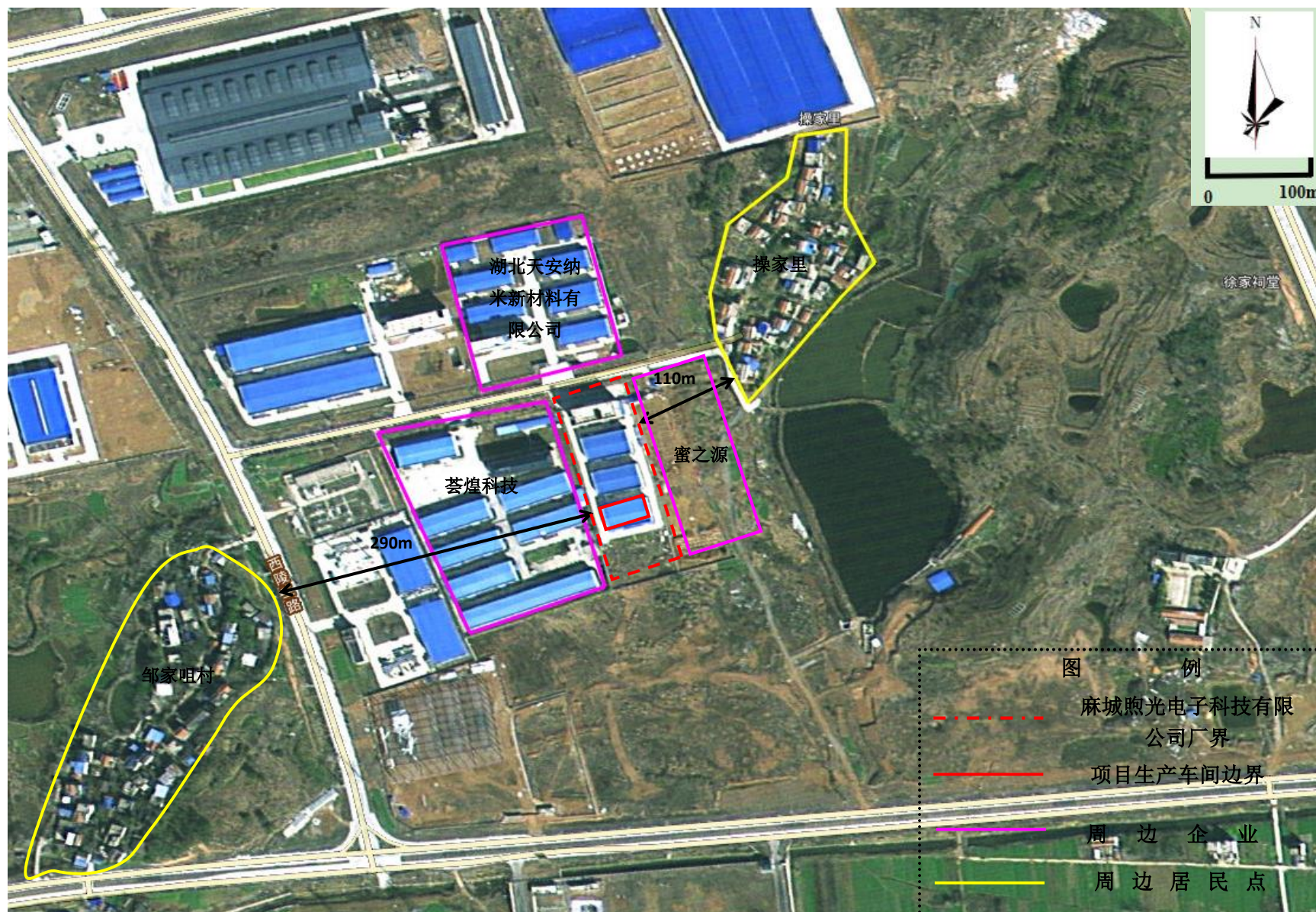
附图2 项目周边环境关系图