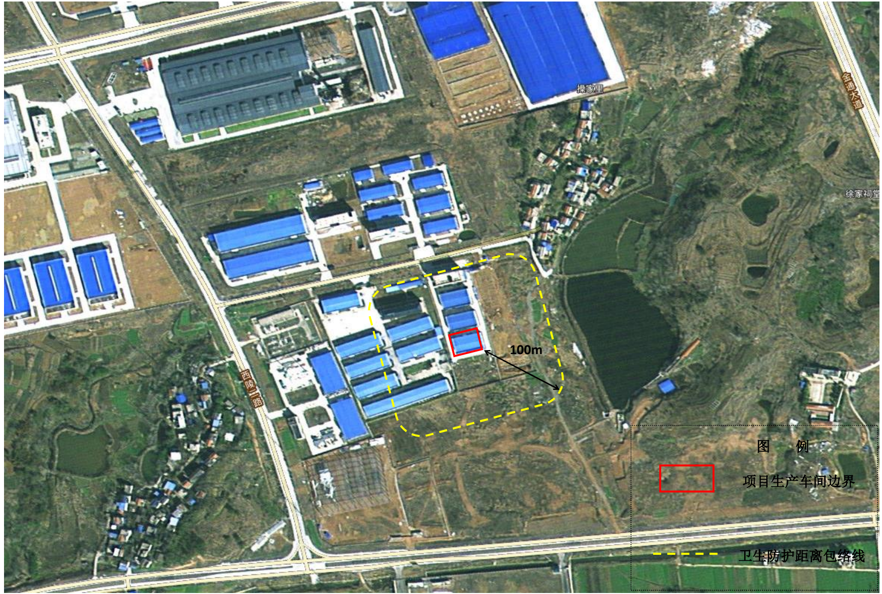
附图5 项目卫生防护距离包络线图